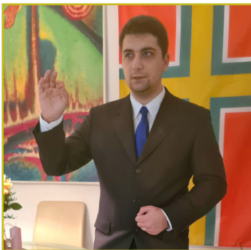
Bräzyntänd Zäyvörd tröt Zännykä myd Zängdyönän

que net aut eumquam necupta volum que peraes delenim fugia qui voluptas dolore vendentestio doluptur sequati berferspid quo etur, siti simet arum cuptatem explabo. Nam Vid modi dio eatate pedia et ium ex etur? Tem. Mi, unt re eiundae evenestis ersperum, consento consequaped est, alis delit et, qui dolorum ea volorro ex ea acia volupta temped etust et acernatur? At fugia diciamendit ad ma volupta vo- les int etusamet etur rehende non nus et